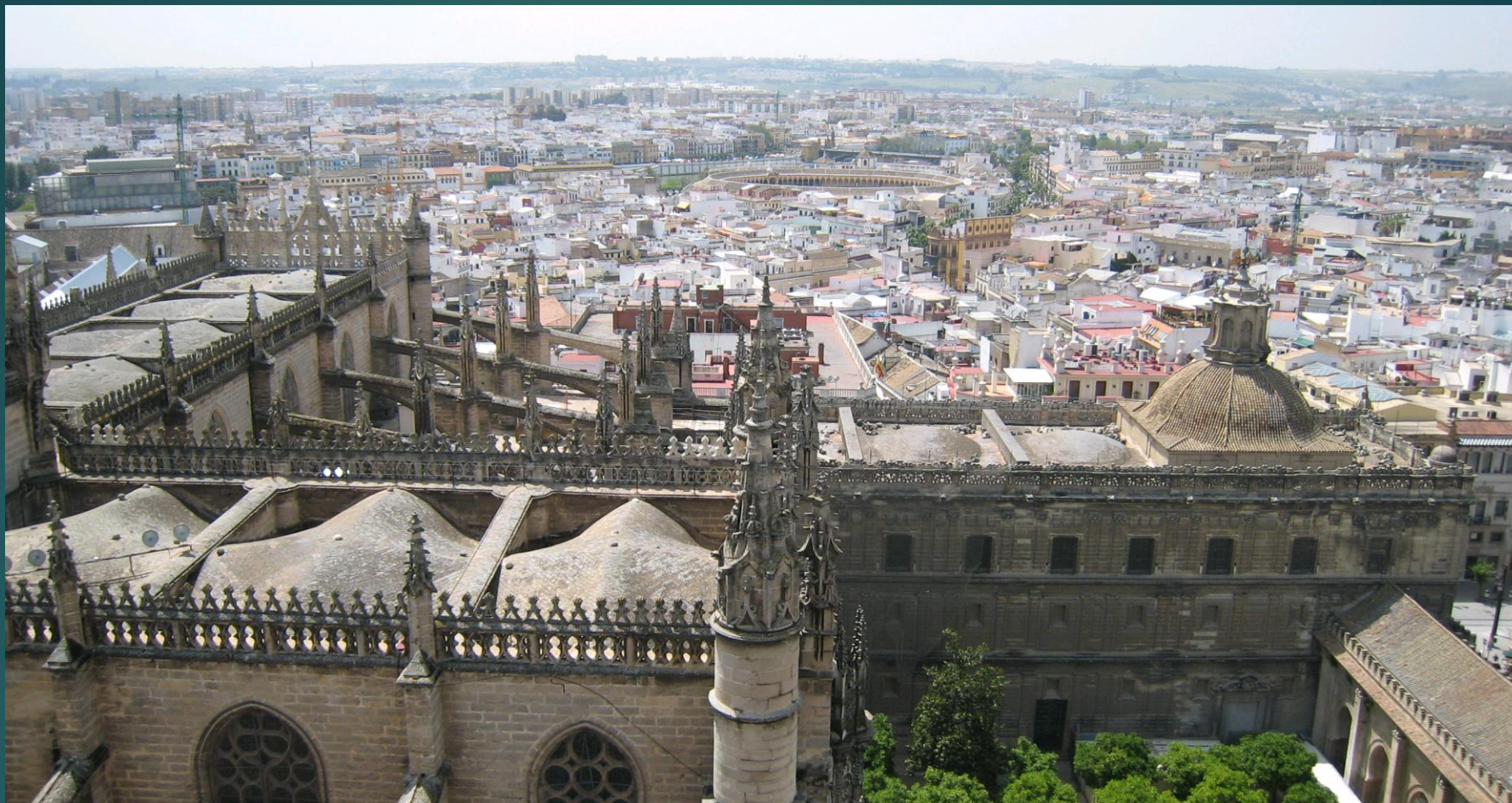
ヒラルダの塔からの眺め、下はカテドラル（大聖堂）