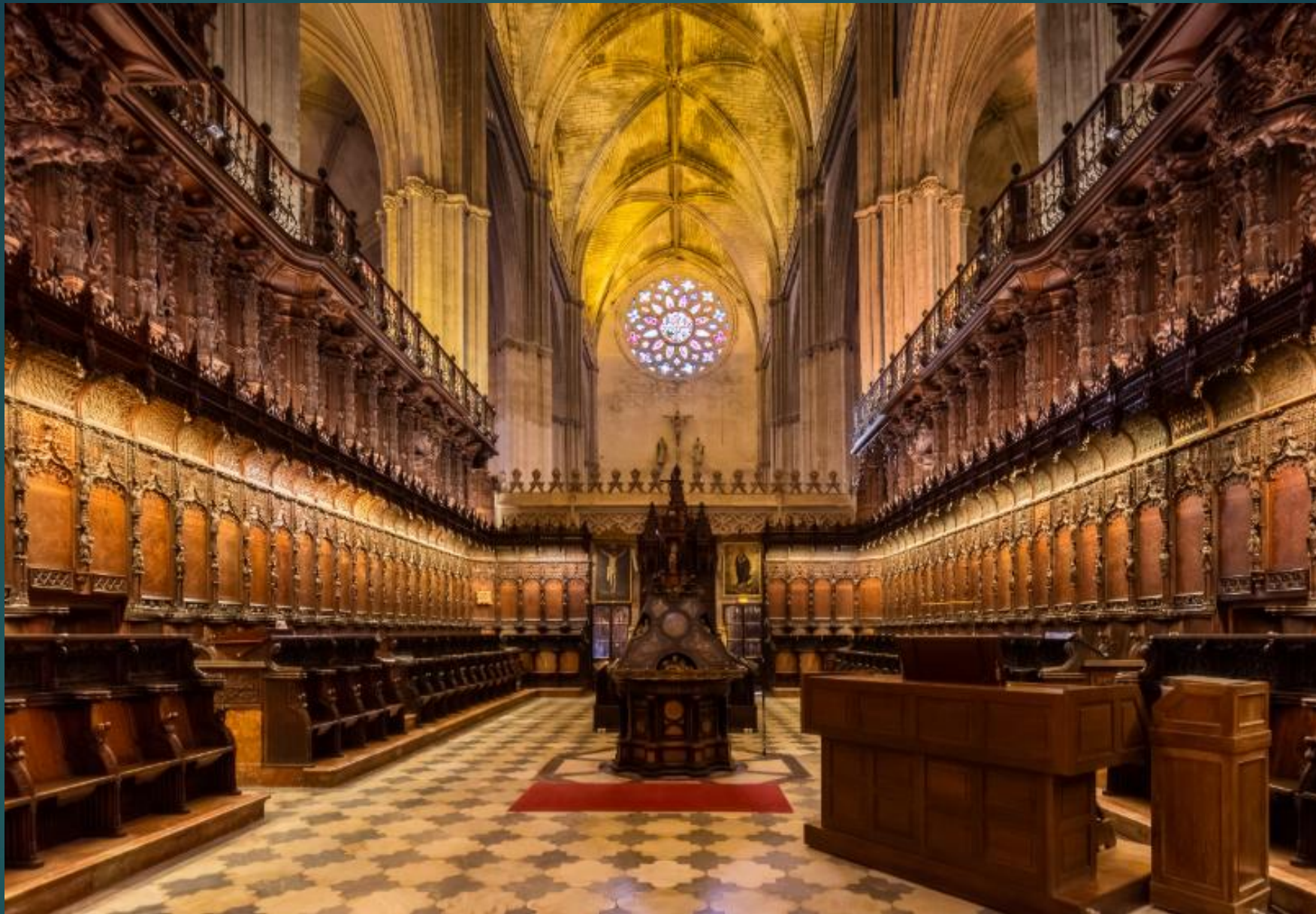
セビリアカテドラルの聖歌隊ロフト(聖歌隊に提供される特定の場所)