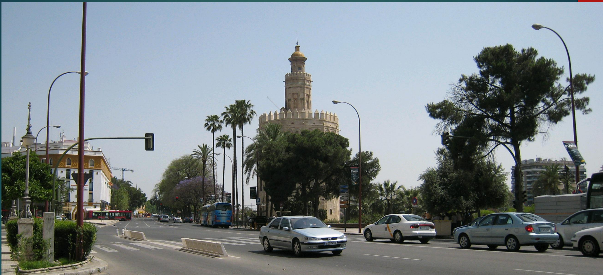
セビリア グアダルキビル川沿いの黄金の塔 (夕日を浴びると黄金に輝くという)