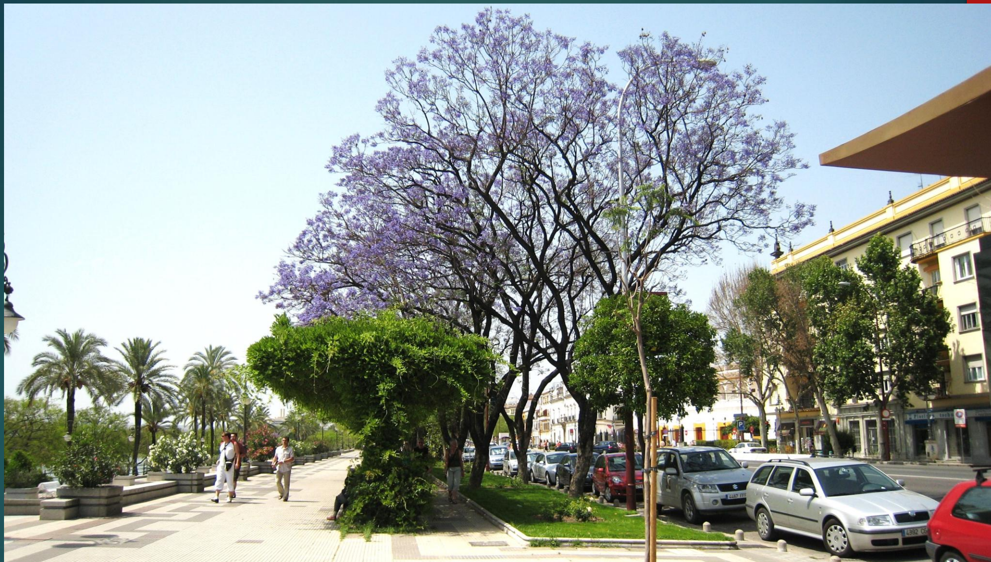
セビリア グアダルキビル川沿いの歩道