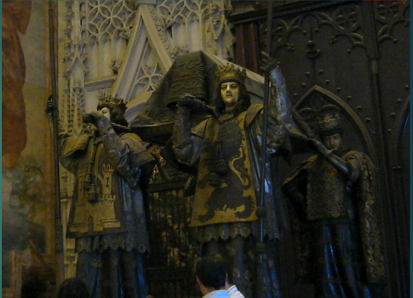
カテドラルの中にあるコロンスのお墓 (コロンスの棺を4人の王様が担いでいる)