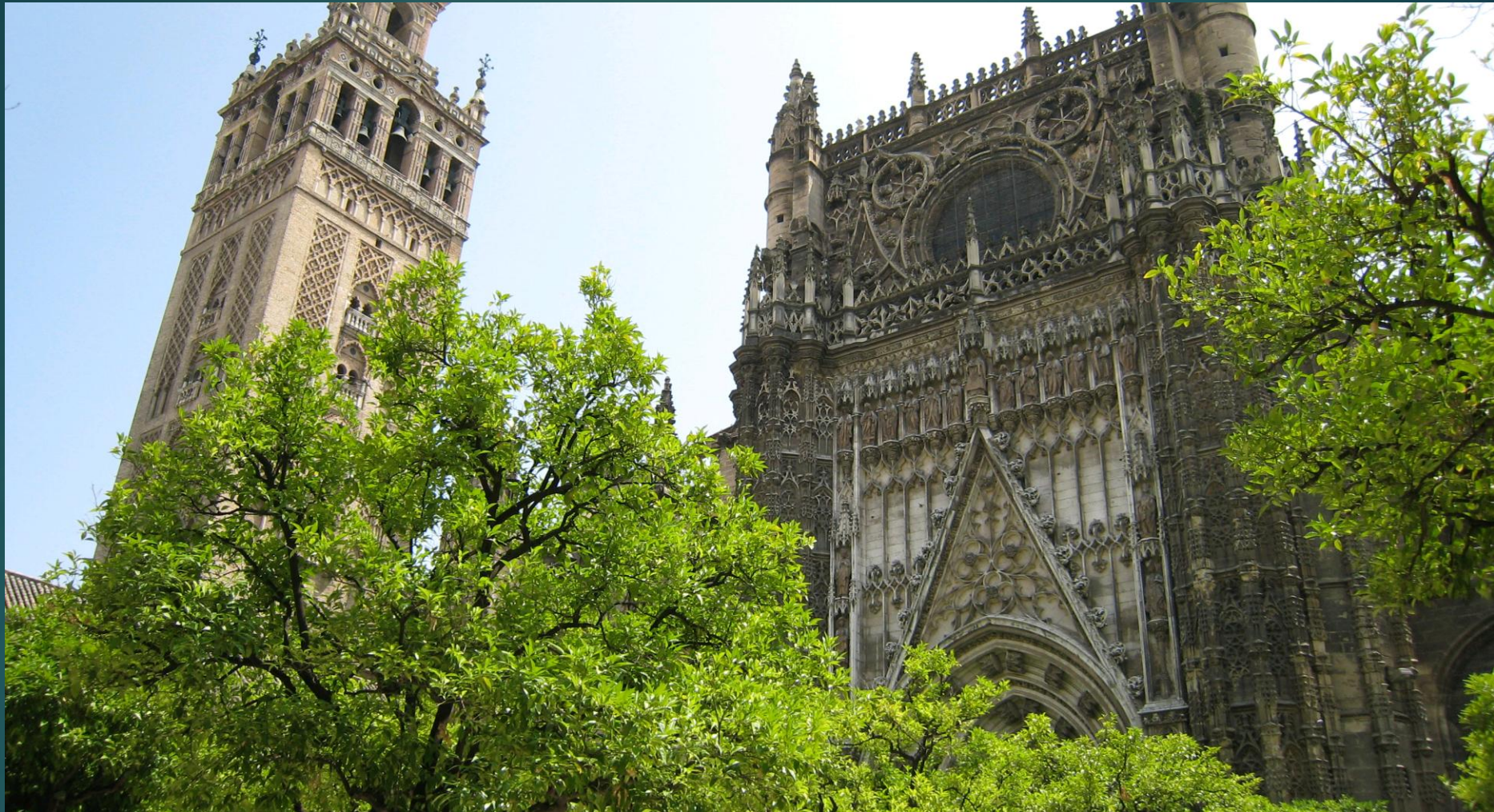
セビリアのカテドラル （左がヒラルダの塔）