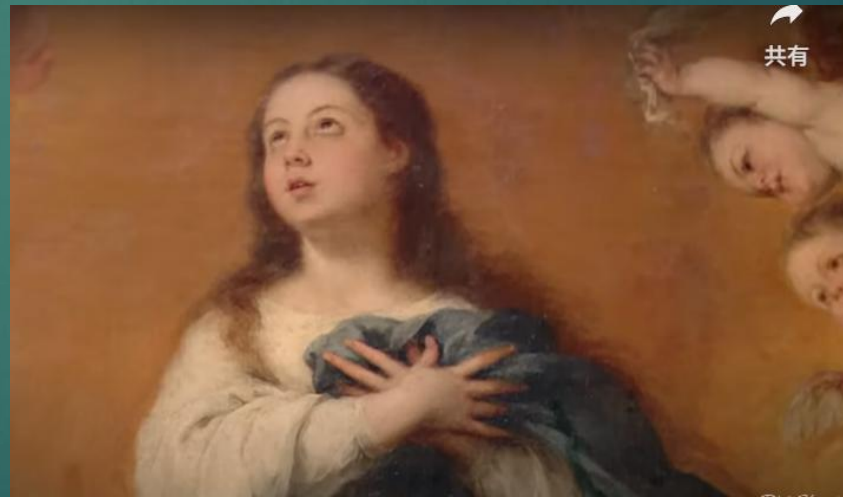
ムリーリョ作の祭壇画