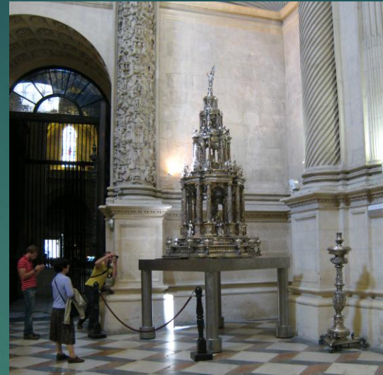
銀で作られた何か？